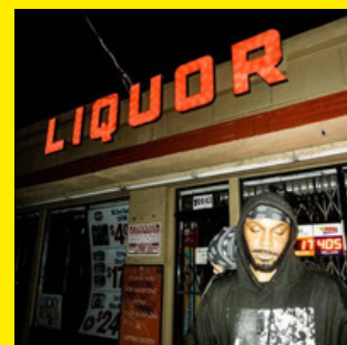
LP! (OFFLINE) JPEGMAFIA