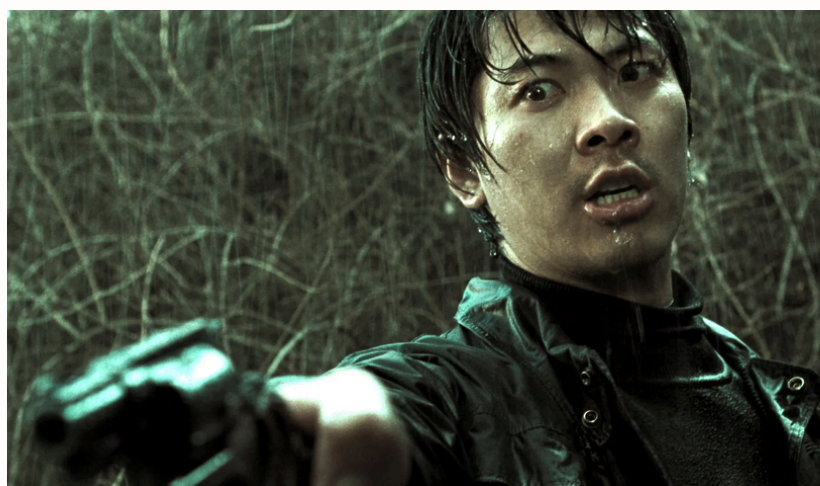
Memories of Murder (2003), réalisé par Bong Joon Ho.

En somme, Memories of Murders présente un thriller policier grisant, que nous ne manquons pas de recommander!