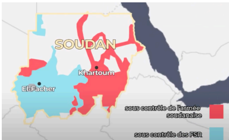
FORCES EN PRÉSENCE AU SOUDAN

La ville d'El Fasher, dernier bastion de l'armée soudanaise au Darfour, est un point hautement stratégique. Au Soudan, deux groupes armés s'affrontent : d'un côté l'armée régulière, dirigée par Abdel Fattah al-Burhan et de l'autre, chef des Forces de Soutien Rapide (FSR) du général Hemedti, un groupe paramilitaire.