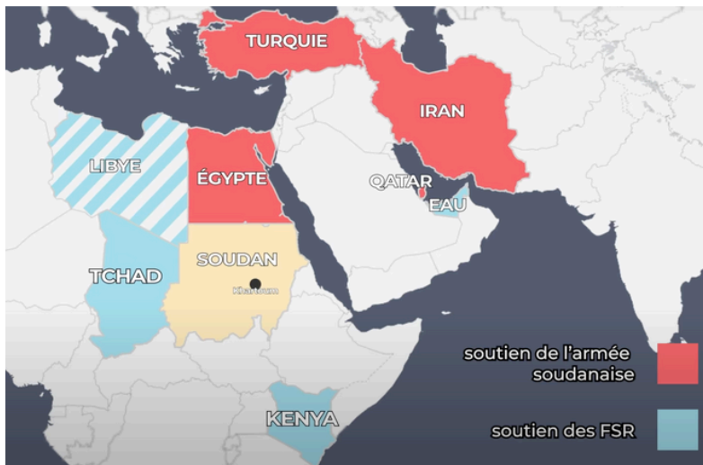
SOUTIEN INTERNATIONAUX AUX FORCES SOUDANAISES

Ce conflit dépasse toutefois la rivalité entre deux généraux : il s'inscrit dans un jeu régional plus large. Les puissances étrangères soutiennent l'un ou l'autre camp selon leurs intérêts. D'un côté, les rivalités du Moyen-Orient se projettent au Soudan ; de l'autre, certains pays du Golfe, confrontés au manque de terres cultivables, investissent dans une logique de land grabbing pour sécuriser leur approvisionnement alimentaire.