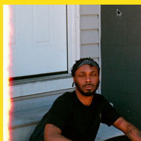
LP! de JPEGMEDIA

L'album du mois : LP! de JPEGMAFIA (L'album s'appelle aussi "Offline")